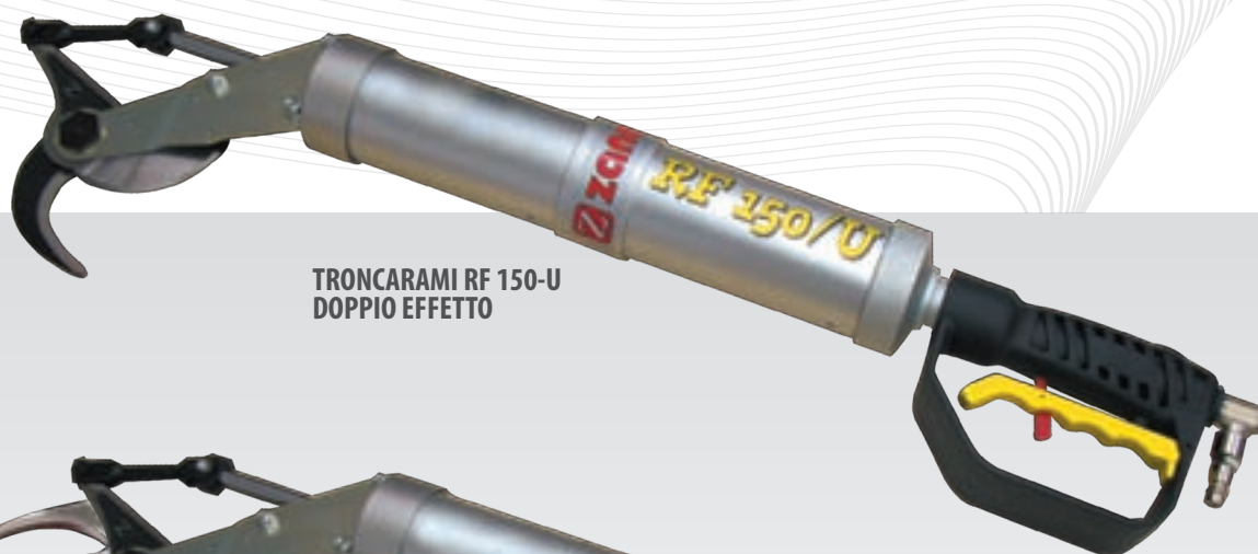
TRONCARAMI RF 150-U DOPPIO EFFETTO