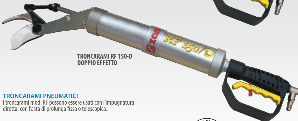
TRONCARAMI RF 150-D DOPPIO EFFETTO