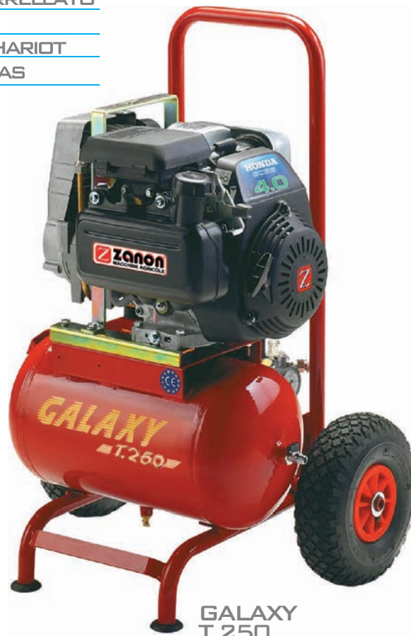
GALAXY T 250